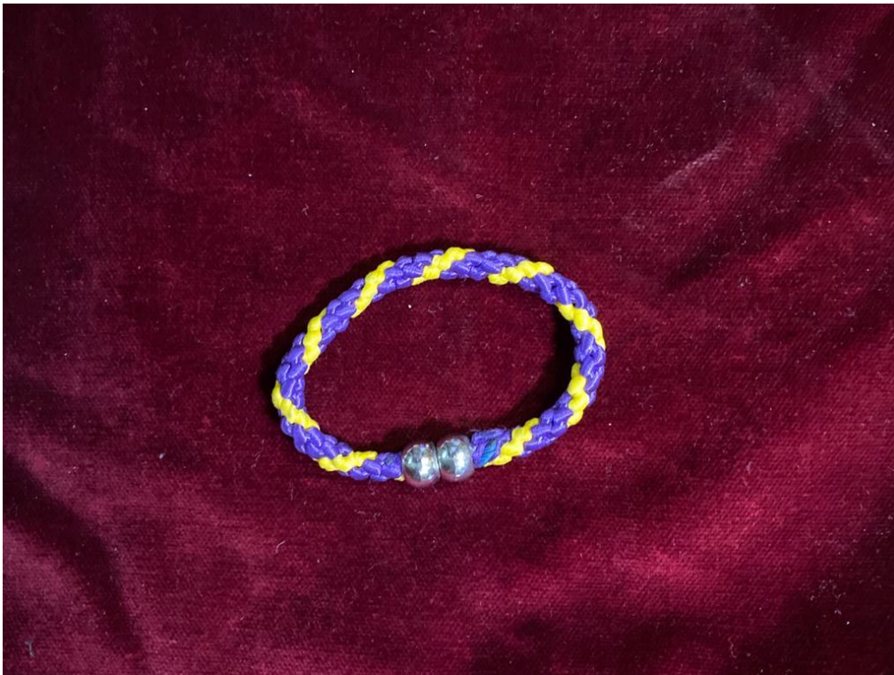
PULSERA BOLA ... 3€