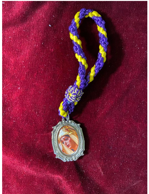
COLGANTE COCHE ... 6€