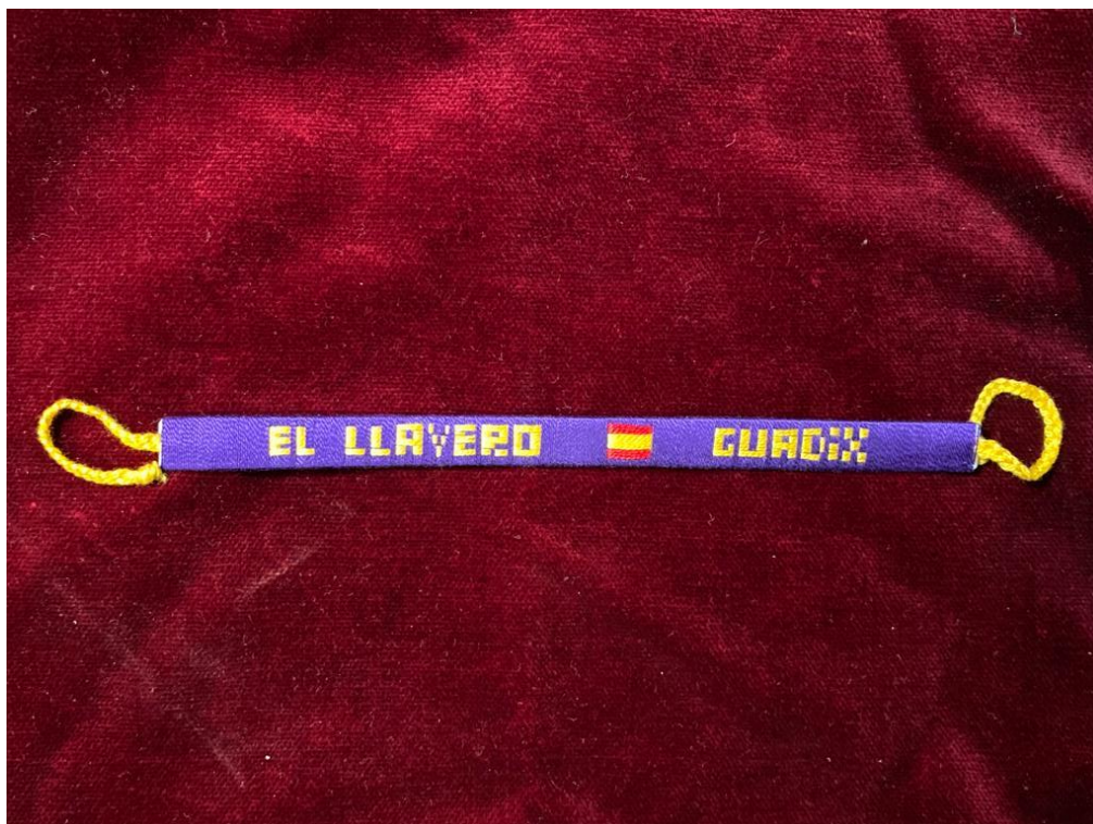
PULSERA "EL LLAVERO" ... 2€