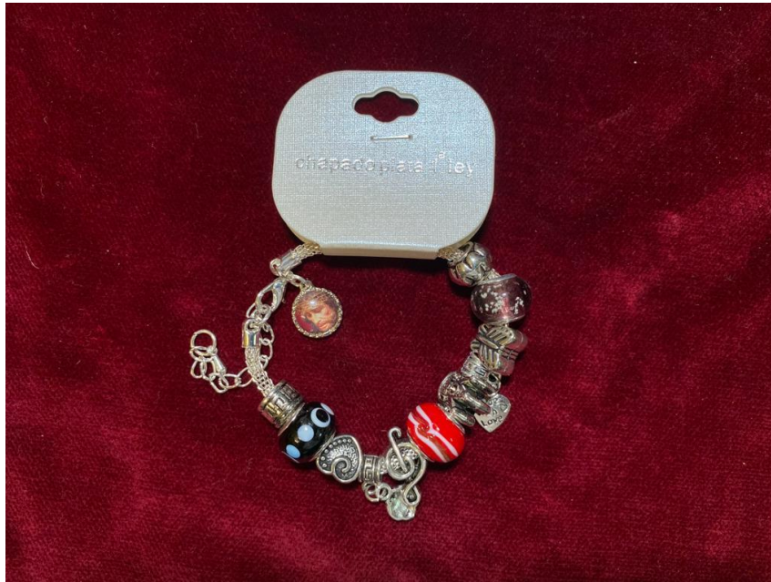
PULSERA PANDORA ... 3€