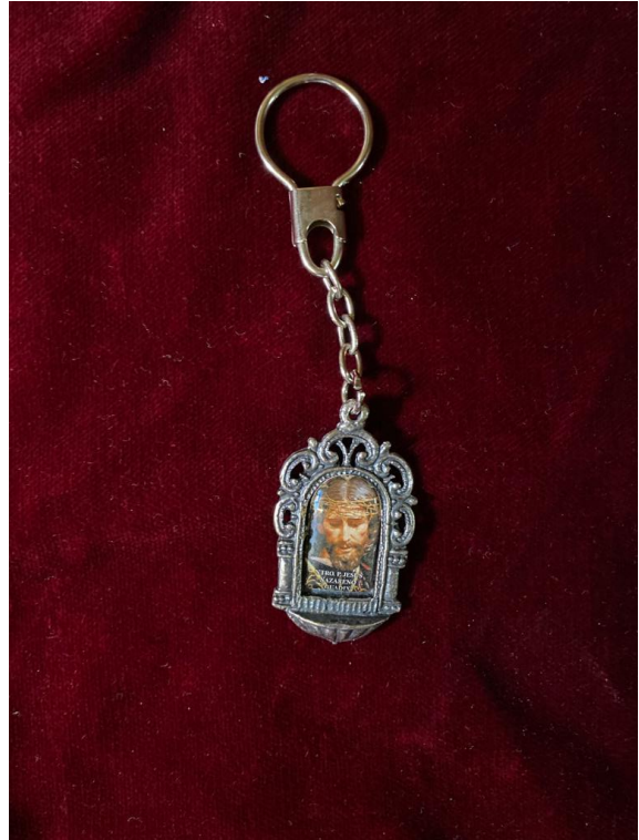
LLAVERO ESTAMPA ... 3€