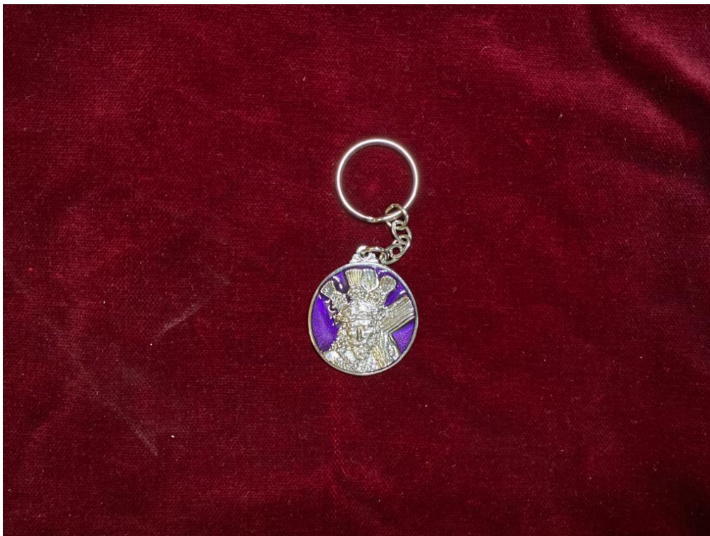
LLAVERO CARA ... 3€