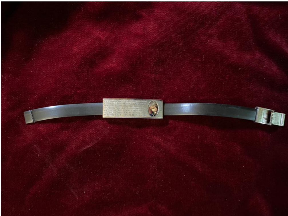
PULSERA INSCRIPCIÓN ... 4€