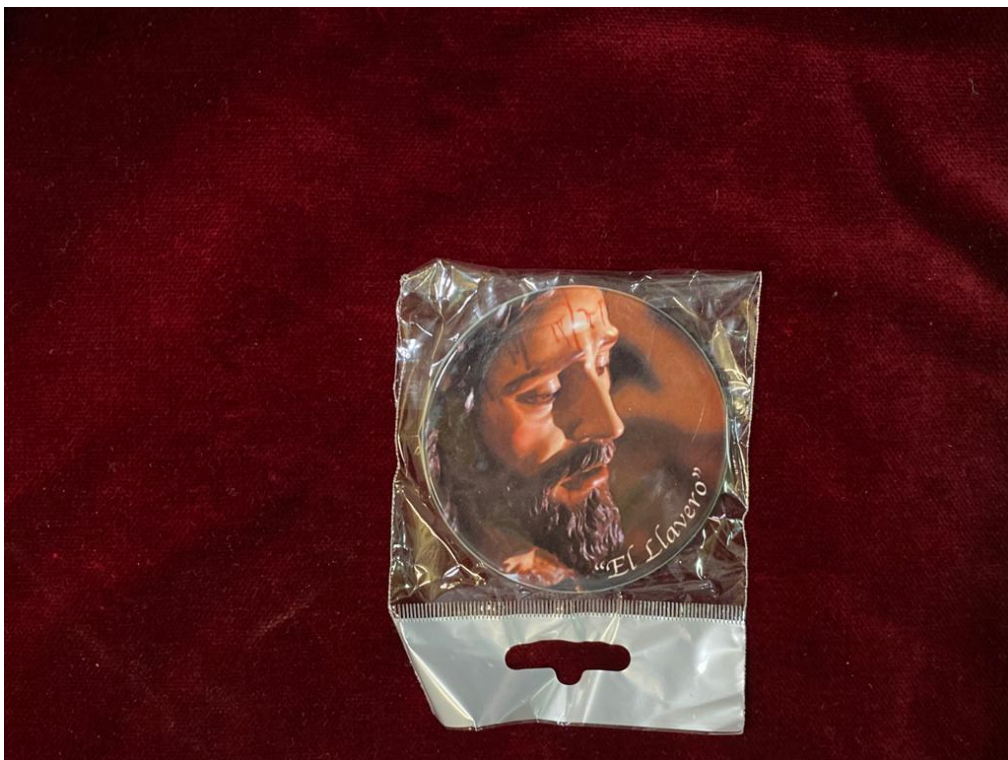
IMÁN NEVERA ... 6€