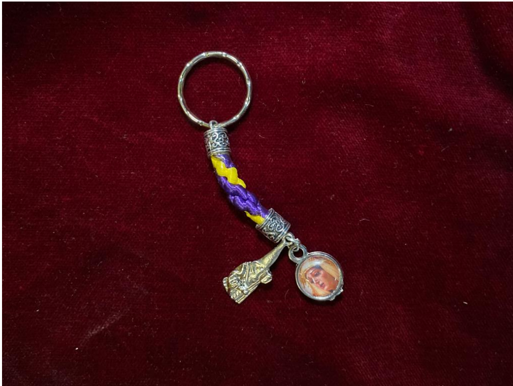
LLAVERO PENITENTE ... 3.5€