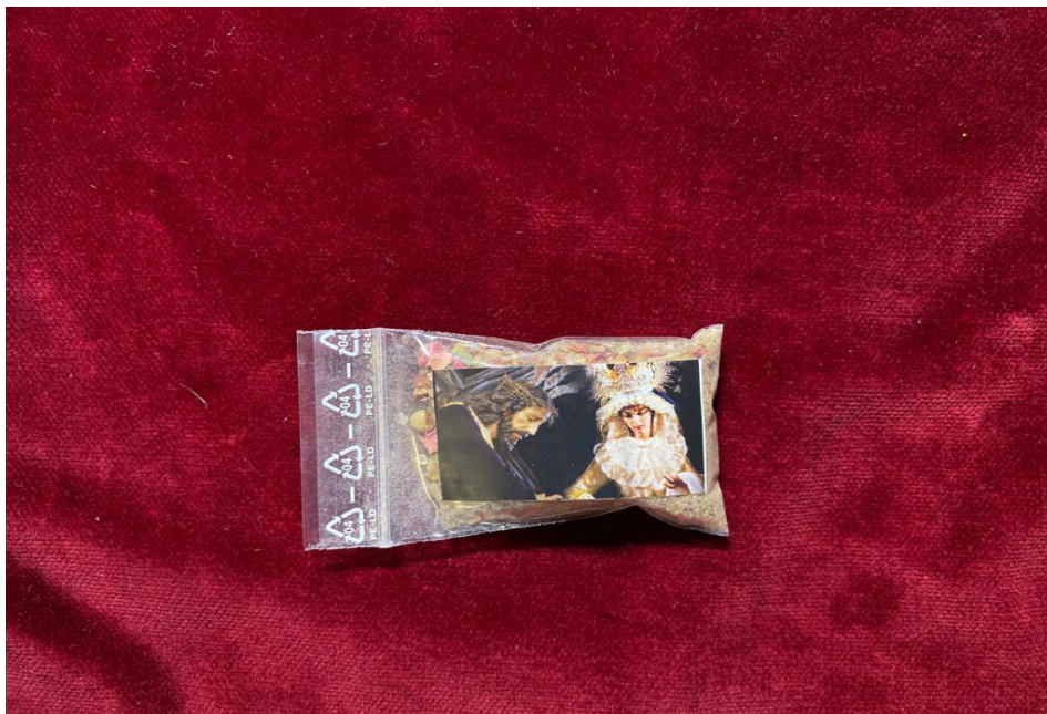
BOLSA DE INCIENSO ... 2€