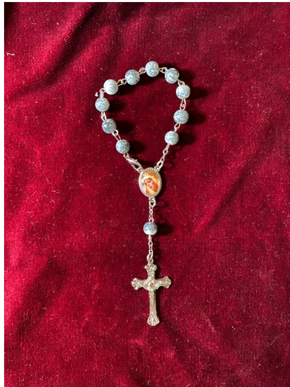
ROSARIO PEQUEÑO ... 5€