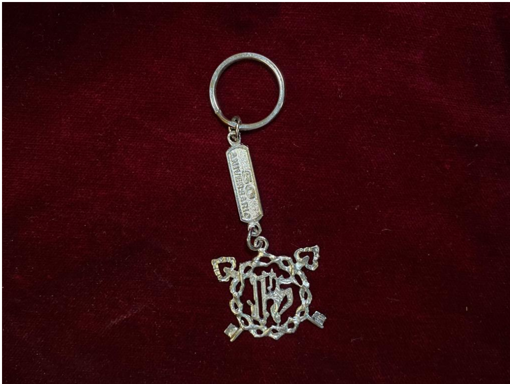
LLAVERO ESCUDO ... 3€