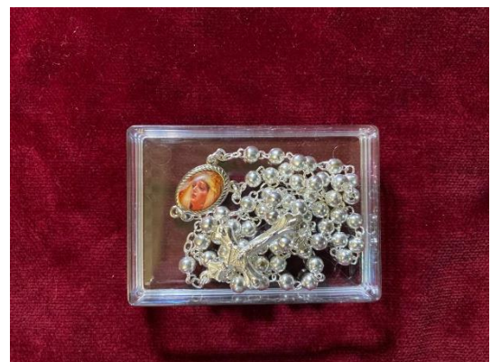
ROSARIO GRANDE ... 10€