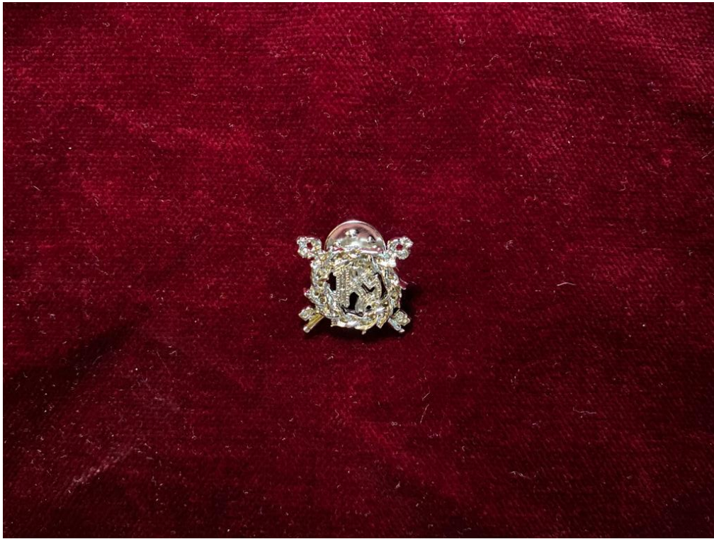
PIN ESCUDO ... 2€