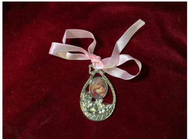
COLGANTE CUNA 5€