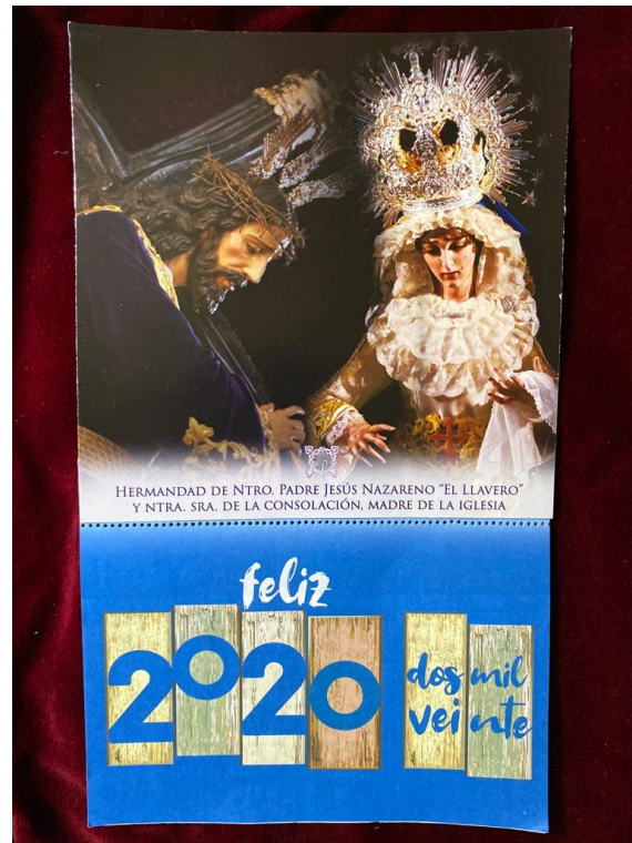
CALENDARIO NEVERA ... 2€