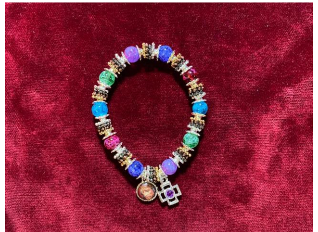
PULSERA ... 3€