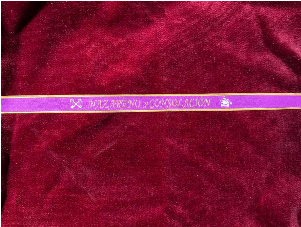
PULSERA DE TELA ... 1€