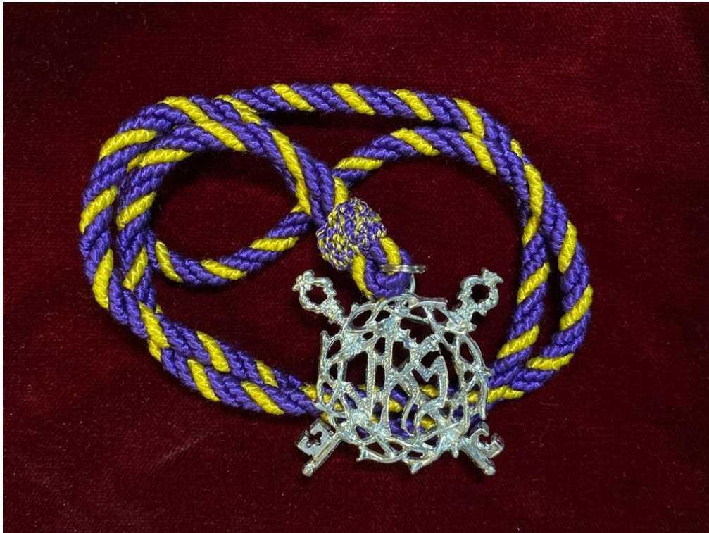
MEDALLA ... 15€